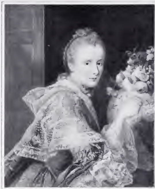
Portrait de la femme de l'Artiste